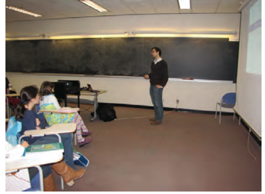
Okulumuzun duzenlediği bu yilki seminer aktivitesi MIT li Turk ogrencilerin asagidaki sunumlarından olusmustur: